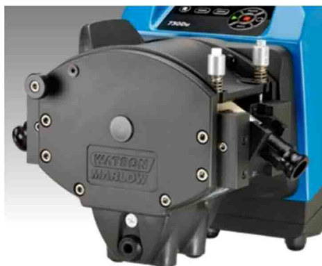
720RE (720REX) 型ヘッド