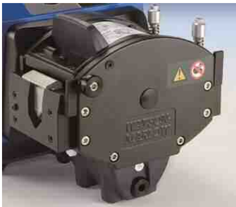
720R (720RX) 型ヘッド