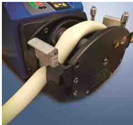
720R (720RX) 型ヘッド チューブ取付部写真

※連続チューブ：材質全4種類：マブレン、バイブレン、シリコン、スタービュアPCS