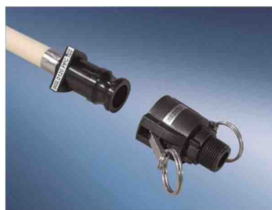
②工業用ロードシュア

※専用チューブ：ロードシュアチューブ (25.4φのみ1インチ、他のサイズは3/4インチとなります)