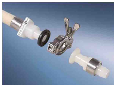
①サニタリ用ロードシュア