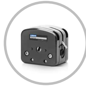
DZ25-3L(アルミダイキャスト)