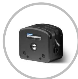
DZ25-6L(アルミ・ダイキャスト)